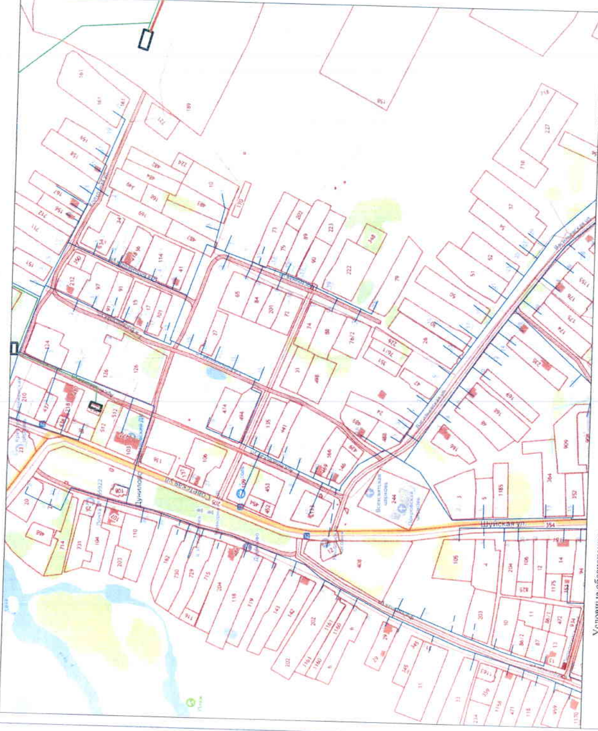
Схема газоснабжения с. Дунилово, лист 2 Шуйского муниципального района