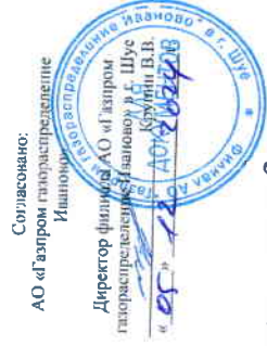
Схема газоснабжения с. Дунилово, лист 3 Шуйского муниципального района