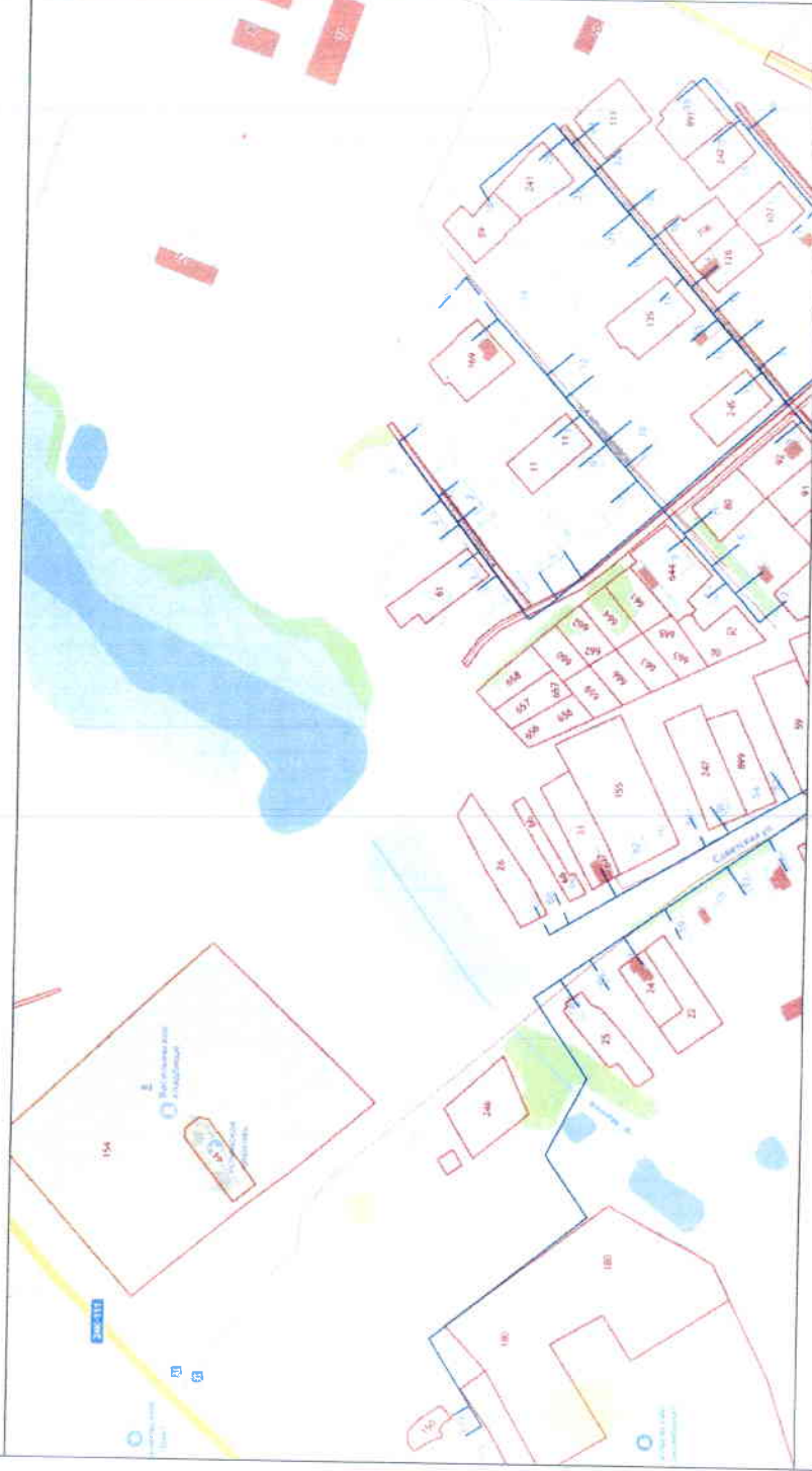
Схема газоснабжения с. Васильевское, лист 3 Шуйского муниципального района