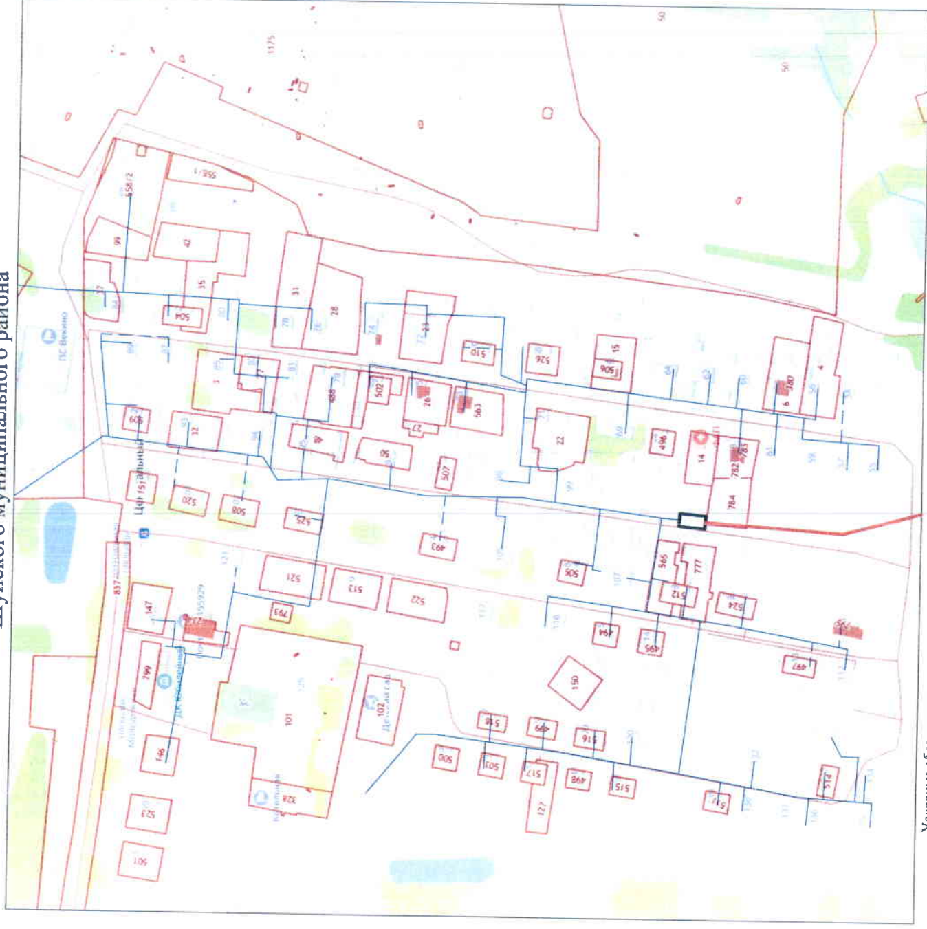
Схема газоснабжения с. Центральный, лист 1 Шуйского муниципального района

Филиала АО «Газпром газоснабжения Иваново» в г. Шуе Крутин В.В. 12 2024 г.